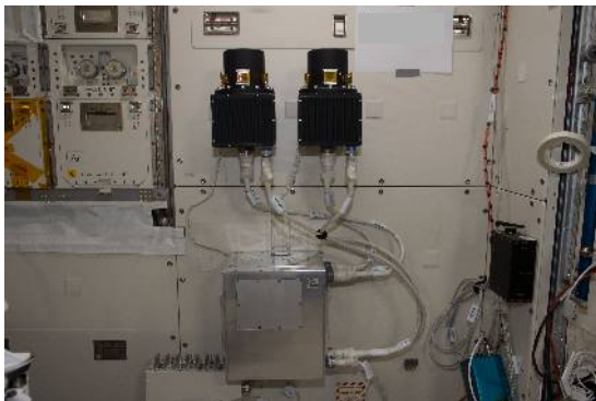
Fig.1 Photo of the PS-TEPC (flight model) inside the Japan Experimental Module of the ISS. The system consists of two detection units (black color, the center of the photo) and a control unit (silver color, below the detection units).

Proportional Counter (TEPC) 5) や国産の Real-time Radiation Monitoring Device-III (RRMD-III) 6) 等があるが、TEPCについては生体組織等価物質で構成されているものの位置検出ができず、線量計測に必要な LET の測定は粗い近似になってしまい（円筒形の場合は形状に依存する系統誤差が 51 %）、事実上、吸収線量のみの実測となっている。