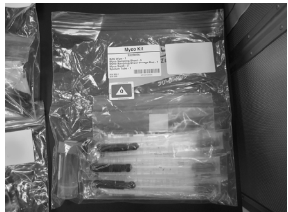
地上に回収された Myco kit

宇宙飛行士は宇宙滞在中、比較的脂性肌になることが経験的に知られている。スポンジバスなどで体を清拭してはいるものの充分とは言えず、好脂性真菌の増殖が原因で皮脂の分泌が亢進され、さらに増殖するという悪循環に陥っている可能性がある。また、脂性肌には船内を漂う塵や埃などが付着しやすくなることもあり、宇宙飛行士の皮膚の状態変化のデータは、感染症やアレルギーのような皮膚疾患の対策をする上でも必要不可欠であり、宇宙飛行士の効果的な除菌等を含めた菌叢管理法開発に繋がる成果が期待されている。