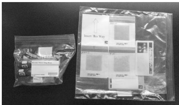
地上に回収された Microbe 実験用サンプリングキット (左) 拭き取りスワブおよび保存用チューブ (右) サンプリングシート

て、打ち上げ・運用開始時から継続的に微生物叢モニタリングを行うことは、ゴミや埃が下に落ちることのない人工的な完全閉鎖型施設という特殊環境における微生物叢形成ならびにその動態を知る上で非常に貴重な機会である。日本における最初の軌道上微生物モニタリング実験となる Microbe-I は、2009 年 8 月から 9 月に掛けて実施された。得られた試料は 17A/STS-128 フライトにより地上に回収され、解析に供された。その結果、軌道上で行われたサンプリングシートでの培養結果は陰性であり、地上において継続培養した結果からも菌の発育は認められなかった。また、培養用のサンプリングシート上に繊維くず等は認められたものの、ヒト毛髪、落屑は認めず、微細集落を含むいかなる菌体も認められなかった。さらに定量 PCR 法による DNA 検出を行ったところ、 Malassezia restricta を含むヒト常在菌、および一般的な環境真菌遺伝子の増幅が確認された。以上のことから、運用開始後およそ 460 日時点における「きぼう」船内は、高い清浄度を保っていることが明らかとなった。但し、ヒト常在菌および一般的な環境真菌遺伝子が検出されていることから、船内にこれら真菌が既に生育していることが示唆される。