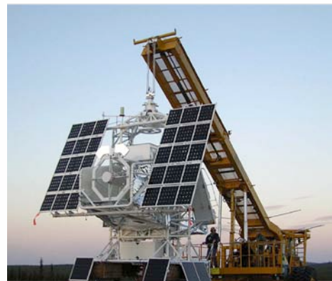
図 1: SUNRISE の外観 (参考文献[1]より)

SUNRISE 気球実験はドイツ・スペインの太陽研究グループが中心となり推進している国際共同太陽観測プロジェクトで、アメリカ NASA の Long Duration Balloon (LDB)プログラムで飛翔実験を行ってきた。口径 1m の光学太陽望遠鏡を搭載し(図 1)、太陽を追尾する大型ゴンドラも専用に開発された(参考文献[1][2]参照)。キルナ ESRANGE から放球され大西洋を越えてカナダまで約 1 週間飛翔する。高度 35-37 km から地上ではできない波長 250-400nm の紫外線観測や大気ゆらぎの影響を受けない安定した可視光観測を 24 時間連続 5 日間以上できる。これまで 2009 年と 2013 年にフライト観測を行った。2 度のフライト観測では、それぞれ太陽活動が静穏な時期(2009 年)と活発な時期(2013 年)で、光球表面の微細磁場構造の観測を行った。1 度目の観測で得られた代表的な成果として、光球表面の対流によって発生する渦状流を発見したこと、磁場構造に付随して超音速の上昇流が頻繁に発生していることが発見されたことなど、数多くの論文が出版された(参考文献[2]参照)。2 度目のフライトで得られた太陽活動領域のデータでも、10 編以上の論文が年内に出版予定である。