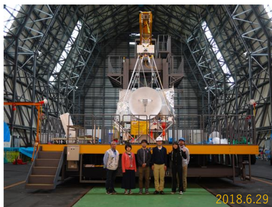
Payload: Balloon-borne VLBI Station

電波干渉計を成層圏に展開することが可能かどうか技術的なフィジビリティを調査する目的で、気球搭載型電波望遠鏡ゴンドラシステムのフライト試験機を開発した (下図)。干渉計としては、Very Long Baseline Interferometry (VLBI) の原理と技術を用いる。VLBI の一素子として必要な機能はすべてゴンドラに搭載し (電波望遠鏡・受信機・周波数変換部・周波数標準源振・高速データ記録装置・局位置決定システム)、飛翔体望遠鏡バスとしての機能 (姿勢決定系・指向制御系・電源系) を