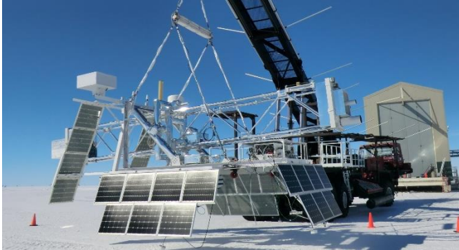
図1: X-Calibur 気球の全体写真。2018年12月の南極フライトで利用。全長~8m。

2018年フライトまでは、硬X線望遠鏡にNASA/GSFCと名古屋大学で製作したInFOCuS望遠鏡を利用しており、ミッション名はX-Caliburであった。次回2022年以降は有効面積が大きな日本製のFFAST望遠鏡を利用するため、XL-Caliburと呼んでいる。